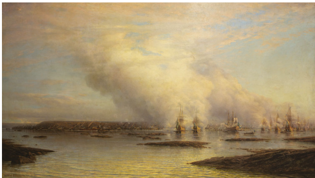
А. П. Боголюбов. Гангутское сражение в Финском заливе 27 июля 1714 г. 1876. ЦВММ

Алексей Петрович Боголюбов – внук Александра Николаевича Радищева, опального автора книги «Путешествие из Петербурга в Москву», после смерти отца, героя Отечественной войны 1812 г., был принят в петербургский Пажеский корпус, а позже переведен в Морской корпус. По его окончании молодой офицер активно нес корабельную службу, но всегда проявлял тягу к изобразительному искусству. В 1845 г. был зачислен в экипаж парусофрегата «Камчатка», где во время путешествия на Мадейру на борту находился зять императора Николая I – герцог Максимилиан Лейхтенбергский, президент Императорской Академии художеств. В час прощания А.П. Боголюбова с герцогом последний произнес слова, ставшие для лейтенанта напутствием: «А Вы, господин Боголюбов, мне сделайте то, что начали. Я жду от вас альбом моего вояжа. Желаю вам счастья и науки, и чем быть дюжинным офицером, будьте художником, кажется, вы тут вновь успеете».