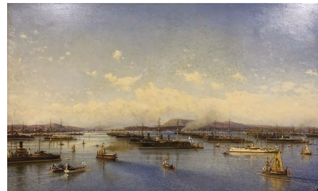
А. П. Боголюбов. Корабли в Тулоне. 1893 (?). КГИОП, Итальянский дворец, Кронштадт

Кораблекрушение фрегата «Александр Невский» 25 сентября 1868 г. стало событием, потрясшим императорский дом. Корабль из-за шторма сел на мель и затонул в Северном море у северо-западного побережья полуострова Ютландия. При кораблекрушении спасся великий князь Алексей Александрович, а сама катастрофа оставила глубокий след в истории русского военного флота. По заказу императора в 1868 г. А.П. Боголюбов написал две картины о крушении фрегата.