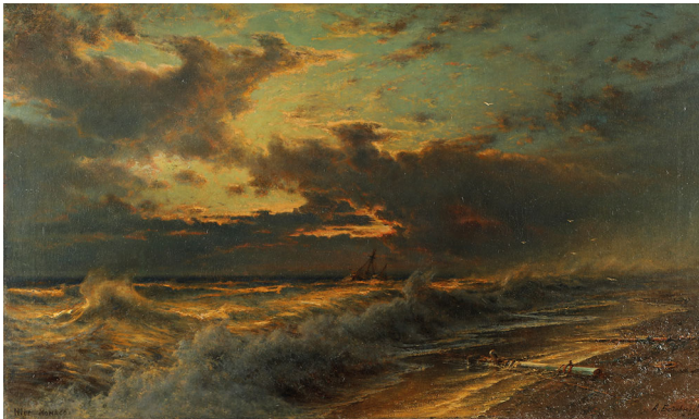
А. П. Боголюбов. Прибой в Ментоне. 1880-е гг. ЦВММ

Средиземноморское побережье стало традиционным местом отдыха русской аристократии. Большой интерес художника вызвала строящаяся дамба в Ментоне, городе, стоявшем на границе Франции и Италии и окруженном горами, окрестности которого «милы и приятны». На основе графических листов в 1880-е гг. А. П. Боголюбов создает картину «Прибой в Ментоне». Пребывание русской аристократии и интеллигенции во второй половине XIX в. на побережье Средиземного моря сблизило русскую и французскую культуры между собой. «Франко-русская дружба, – отмечал в 1895 г. «Вестник Европы», – сделалась залогом мира, а не орудием вражды». А. П. Боголюбов написал масштабную картину «Корабли в Тулоне» (1895). Картина была приобретена у художника цесаревичем Николаем II и подарена в 1896 г. Кронштадтскому морскому собранию. Прибытие императорской эскадры в Тулон и оформление русско-французского союза в дальнейшем стало основой создания Антанты, что явилось образованием двух крупных противостоящих группировок и повлекло за собой существенное изменение в соотношении и расстановке сил в Европе.