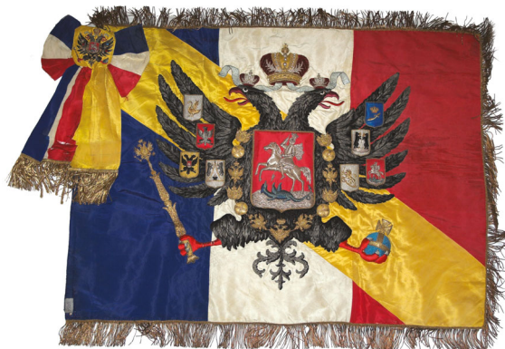
Подарочное знамя, преподнесенное жителями г. Тулона морякам Русской эскадры во время ее визита во Францию. 1893. ЦВММ

Внимательно изучая старинные гравюры, документы и будучи профессиональным моряком, художник точно изображал рангоут и такелаж. По высочайшему заказу маринист обратился к сюжетам Северной войны (1700–1721). В 1866 г. он написал картину «Бой у о. Эзель 24 мая 1719 г.», где довольно подробно изобразил баталию русских кораблей под командованием капитана 2 ранга