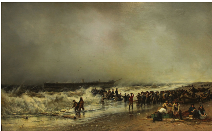
А. П. Боголюбов. Выход великого князя Алексея Александровича из катера в буруны (после крушения винтового фрегата «Александр Невский»). 1868. ЦВММ

Художник стал современником Крымской (Восточной) войны 1853–1856 гг. В Синопском сражении турецкая эскадра была разгромлена эскадрой Черноморского флота под командованием вице-адмирала П.С. Нахимова 18 (30) ноября 1853 г. По заказу императора Николая I это сражение было запечатлено А.П. Боголюбовым. Маринист отправился на черноморское побережье для создания рисунков и этюдов к картине. Синопский рейд произвел на художника неизгладимое впечатление, а созданное масштабное полотно в 1860 г. экспонировалось в Белом зале Зимнего дворца.