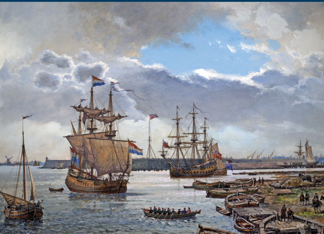
А.А. Тронь Приход первого иностранного судна в Санкт-Петербург. 1703 г. Студия художников-маринистов при Центральном военно-морском музее, 2003

М орская столица России — один из многочисленных титулов Петербурга. Петр I задумал новый город как будущий порт для торговых связей с европейскими государствами. Удобное транспортное расположение по отношению к Европе (на берегу Балтийского моря) предопределило бурное развитие города.