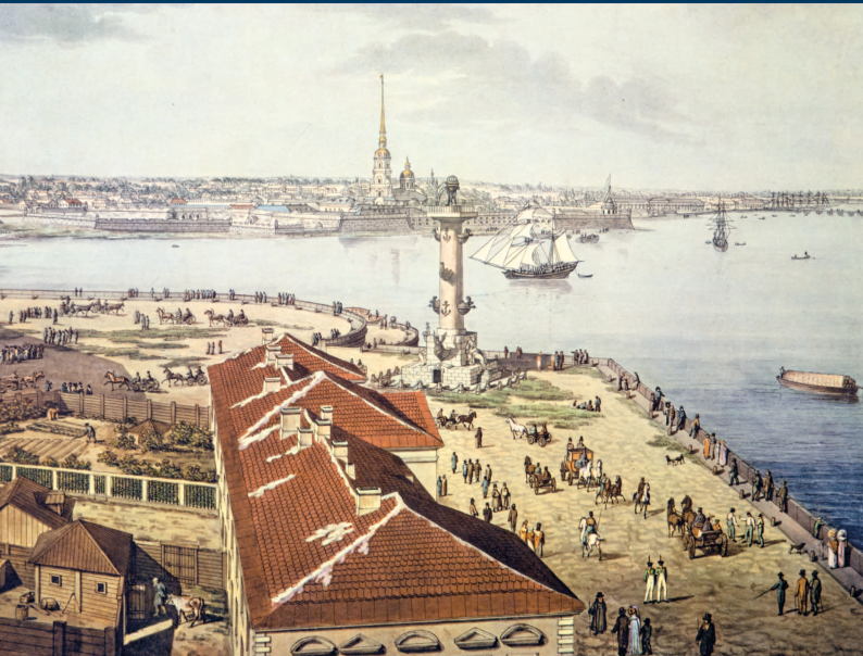
А. Тозелли Панорама Петербурга (фрагмент) 1817–1820

Панорама выполнена с башни Кунсткамеры. Мастер запечатлел основные доминанты города начала XIX века.