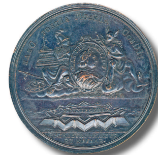
С.Ю. Юдин Медаль «В память основания Петербурга. 1703 г.» 1760-е

Оборотная сторона — копия с медали Ф.Г. Мюллера 1710–1713 гг. Восседающие на облаках Меркурий с кадудеем и Минерва с моделью Кроншлота держат овальный медальон с портретом Петра I в лавровом венке, доспехах и мантии, по кругу которого надпись: «СZAR. PET. ALEXII. F.» («Царь Петр Алексея сын»). Под облаками вид на маленькие домики первых лет строительства города и в обресе посреди Невы аксонометрический план крепости с надписью «S.PETERSBURG». («Санкт Петербург»). Надпись по кругу: «NAEC FORTIA MOENIA CONDIT». («Основывает эти крепкие стены»). Хронограмма «1703». В обресе: «PETRIBURGI PORTUS / ET NAVALE» («Гавань и корабельная верфь Петербурга»).