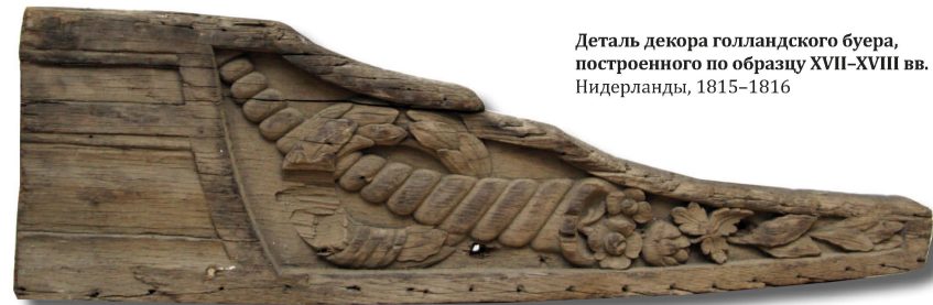
Деталь декора голландского буера, построенного по образцу XVII-XVIII вв. Нидерланды, 1815-1816

29 июня (10 июля), в Петров день, была заложена деревянная церковь Святых апостолов Петра и Павла. Церковь имела две башни со шпиками, обрамляющими вход. Петропавловский собор строился 21 год, с 1712 по 1733 годы, по проекту архитектора Доменико Трезини — первого архитектора Петербурга.