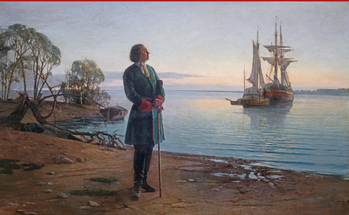
Н.Ф. Добровольский «Здесь будет город заложен...» 1880

16 (27) мая 1703 года, в самом начале Великой Северной войны 1700-1721 годов, на болотистом Заячьем острове в дельте Невы по указу царя Петра I была заложена деревоземляная крепость Святого Петра — Санктпетербургская, будущее сердце морской столицы нового государства — Российской империи.