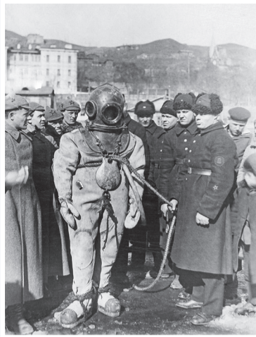
Тихоокеанская экспедиция ЭПРОНа. 1930-е годы

В 2023 г. исполняется 100 лет ЭПРОНу – Экспедиции подводных работ особого назначения. В честь этого события в ЦВММ 25 мая 2023 г. открылась выставка «ЭПРОН: завоевание глубин». Экспедиция была учреждена при Особом отделе Государственного политического управления в марте 1923 г.