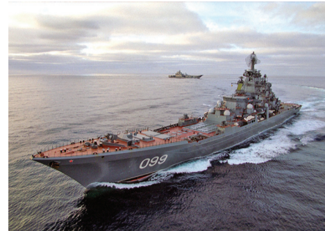
Тяжелый атомный ракетный крейсер «Петр Великий» проекта 1144

Опыт действия эскадры по отстаиванию геополитических интересов нашей Родины востребован новым поколением моряков, и именно в этом ценность ее исторического пути и славных свершений и побед.