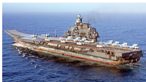
Тяжелый авианесущий крейсер «Адмирал Флота Советского Союза Н. Г. Кузнецов» проекта 1143.5

Эскадру называли авианесущей, ведь истоки освоения отечественных авианосных кораблей находились именно в этом объединении. Здесь 28 декабря 1975 года был принят в состав ВМФ первый советский тяжелый авианесущий крейсер «Киев», который выполнил задачи десяти боевых служб и прошел более 240 тысяч миль.