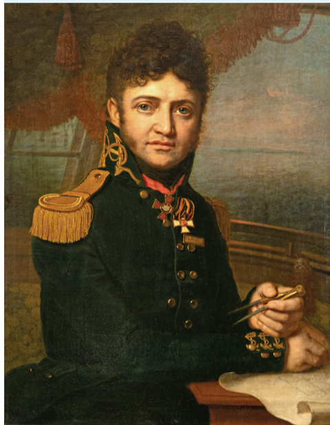
В. Л. Боровиковский. Капитан 1 ранга Ю. Ф. Лисянский

Первая половина XIX века вошла в историю России, как период активного исследования и освоения новых территорий, открытия морских транспортных путей, установления дипломатических отношений с государствами Дальнего Востока. В ряду выдающихся экспедиций того времени особая роль принадлежит первому в истории русского флота кругосветному плаванию кораблей «Нева» и «Надежда». Руководил экспедицией капитан-лейтенант И. Ф. Крузенштерн, командовав-