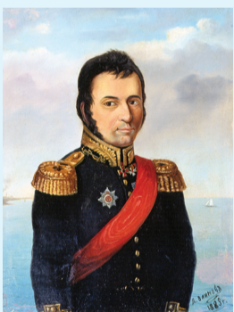
Л.Д. Блинов. Вице-адмирал В.М. Головнин

В ряду многочисленных экспедиций русских моряков из Кронштадта на Камчатку и в российские североамериканские владения поход 16-пушечного шлюпа «Диана» под командованием капитана 2 ранга В.М. Головнина в 1807–1809 годах с целью гидрографического исследования вод Тихого океана был полон драматических приключений. Имея разрешение от английского правительства на свободный проход шлюпа через их вла-