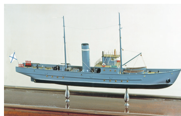
Ю. И. Федоров Модель тральщика «Запал» (1915)

Опыт борьбы с минами в Русско-японской войне был