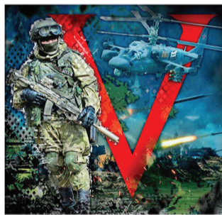
По материалам газеты «На страже морских рубежей Отечества» № 13, 1 июня 2023 г.

Благодаря смелым и мужественным действиям Егора Сапунова российским подразделениям удалось прорвать участок обороны противника и развить наступательные действия.