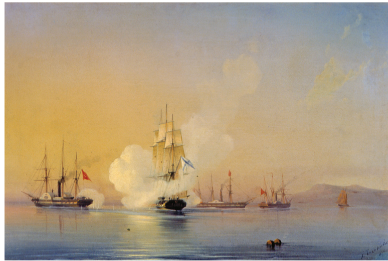
А. П. Боголюбов. Бой 44-пушечного фрегата «Флора» с тремя турецкими пароходами в районе Пицунды 9 ноября 1853 г.