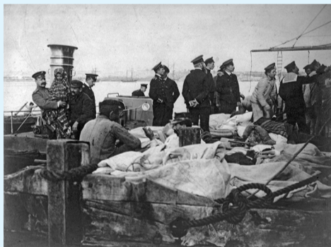
Высадка итальянских жителей, спасенных после землетрясения в Мессине, пристань. 1908 г.

Моряки «Цесаревича» и «Славы» разжигали костры и готовили горя-