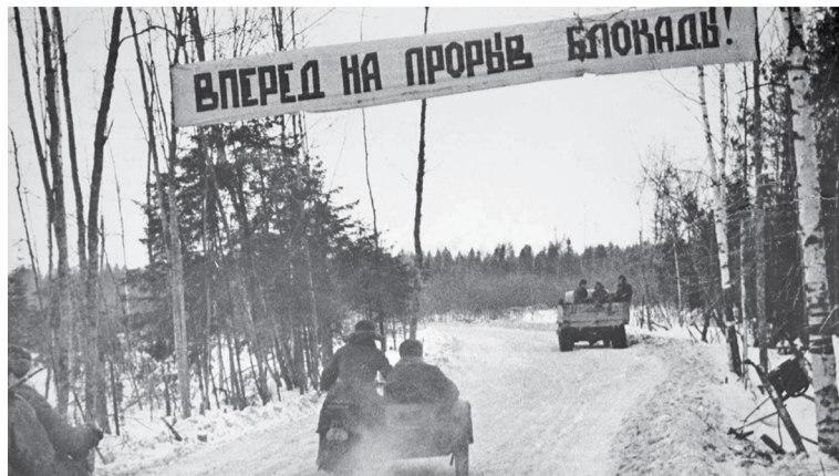
Прифронтовая дорога. Ленинградская область. 1942 г.