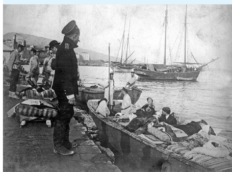
Землетрясение в Мессине. Переправа раненых горожан на русские корабли. 1908 г.

Трагедия случилась 28 декабря 1908 года. Мощное землетрясение магнитудой 7,5 балла произошло в Мессинском проливе между Сицилией и Апеннинском полуостровом. Рядом проводили учения русские корабли Балтийского учебного отряда под командованием контр-адмирала Владимира Ивановича Литвинова. Русские моряки линейных кораблей «Цесаревич», «Слава», а также крейсеров «Адмирал Макаров» и «Богатырь» немедленно прекратили учения и пришли на помощь сицилийцам.