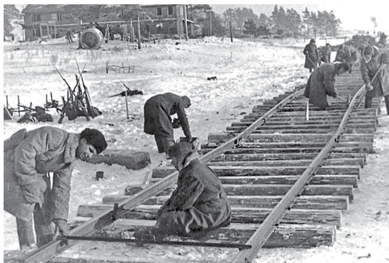
Прокладка путей возле Рабочего поселка № 1. 1943 г.