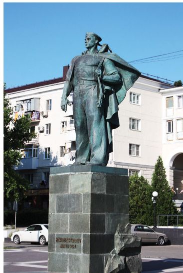
Памятник Неизвестному матросу в Новороссийске

В 1975 году он находился в Краснодарском военном госпитале. Здесь результаты его лечения, а также личное знакомство с Леонидом Ильичом Брежневым повлияли на судьбу препарата «Бализ-2».