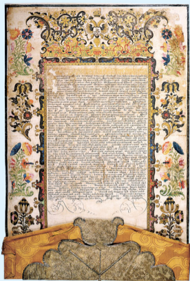
Жалованная грамота Петра I на вотчину боярину Головину Федору Алексеевичу

Ушедший 2022 год прошел под знаком 350-летия со дня рождения императора Петра Великого.